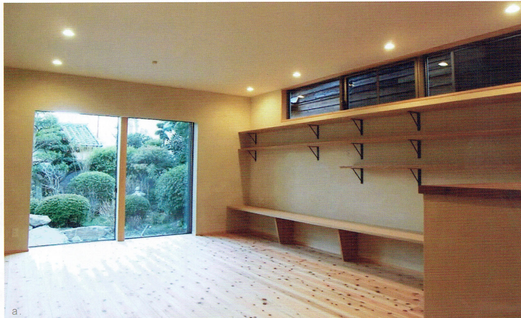
a. LDKから庭を眺める。サッシの存在感を消す為、ひと工夫。床は杉板、壁は珪藻土仕上げとしている為、珪藻土の壁には程よい陰影があり落ち着いた空間に。b. リビングからキッチンを見る。キッチン背面には大容量の収納を設けました。c. 壁面にはオーダーの飾り棚とテレビボードを設置。d. キッチンの背面収納。左半分は家電収納 (b 参照)、右半分は食器収納兼パントリー。棚は全て可動式としている為、無駄なく収納出来ます。